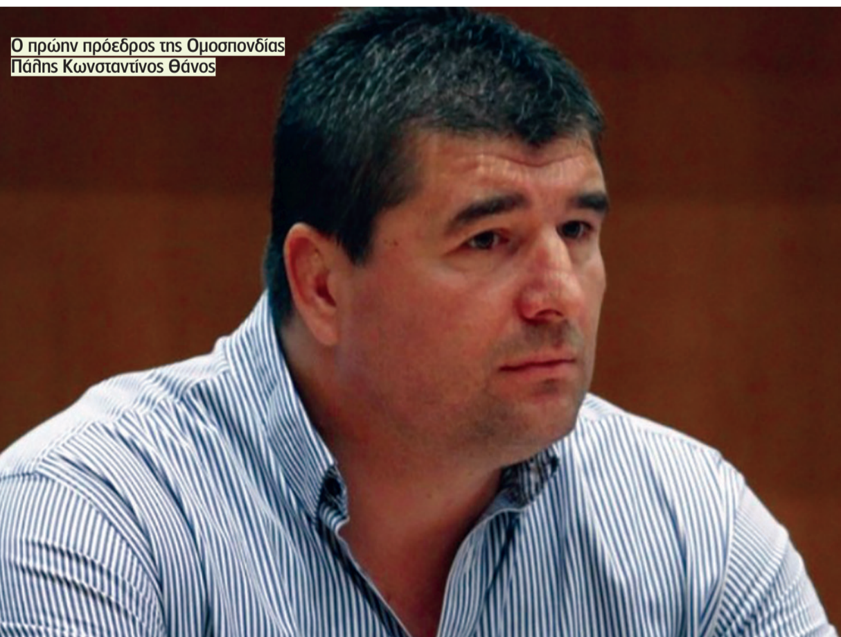
Ο πρώην πρόεδρος της Ομοσπονδίας Πάλης Κωνσταντίνος Θάνος

ΜΙΑ ΙΣΤΟΡΙΑ ΦΡΙΚΗΣ με πρωταγωνιστή τον 48χρονο προπονητή πάλης Σπύρο Μπούσουλα και θύμα μια 14χρονη αθλήτριά του, αλλά και την οικογένειά της, αναβιώνει αυτές τις ημέρες στο Μικτό Ορκωτό Δικαστήριο της Αθήνας. Οι απίστευτες λεπτομέρειες μιας καθαρά τυπικής σχέσης μεταξύ προπονητή και ανήλικης αθλήτριας -η οποία όμως κατέληξε, σύμφωνα με το κατηγορητήριο, στη σύναψη ερωτικής σχέσης, καταγγέλθηκε από τη μητέρα της ανήλικης και είχε ως αποτέλεσμα τον Νοέμβριο του 2017 ο Μπούσουλας να συλληφθεί, να κατηγορηθεί για κακουργήματα και εν τέλει να προφυλακιστεί- αναμένεται να αναβιώσουν εντός της δικαστικής αίθουσας, σε μια υπόθεση η οποία συγκλόνισε το πανελλήνιο.